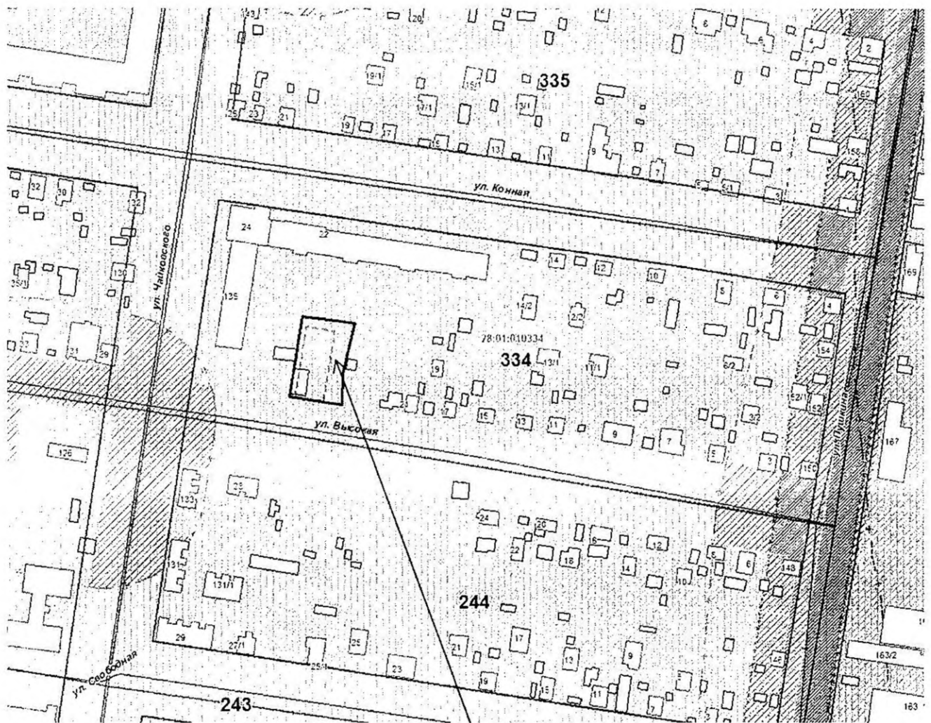
земельный участок с кадастровым номером 28:01:010334:16

к проекту постановления администрации города Благовещенска «О предоставлении разрешения на условно разрешенный вид использования земельного участка с кадастровым номером 28:01:010334:16, расположенного в квартале 334 города Благовещенска»